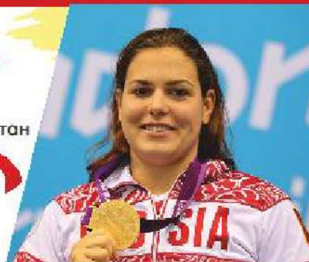
ОКСАНА САВЧЕНКО Восьмикратная Паралимпийская чемпионка

НАСТОЯЩИЙ ТЫ НАСТОЯЩИЕ ДРУЗЬЯ НАСТОЯЩАЯ ЛЮБОВЬ НАСТОЯЩЕЕ ДЕЛО